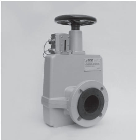
Accionamiento manual Manual operation