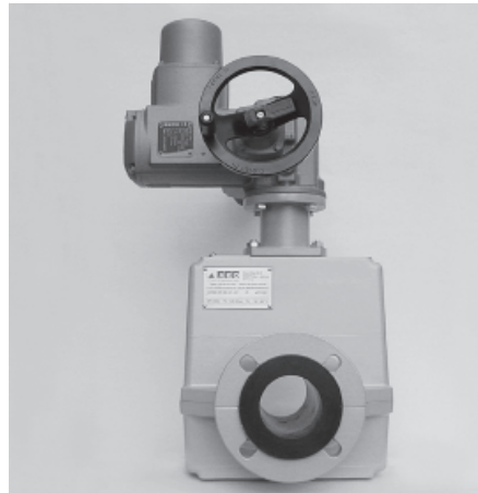
Accionamiento electromecánico Electro-mechanical operation

▲ El nuevo diseño de la válvula mecánica con paso de válvula libre, sirve para bloquear medios abrasivos, fibrosos, porosos y viscoso, como p. ej. granulados, lodos o suspensiones.